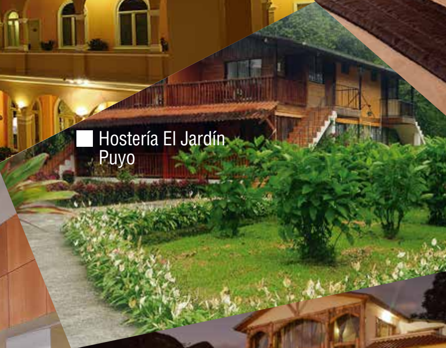
■ Hostería El Jardín Puyo