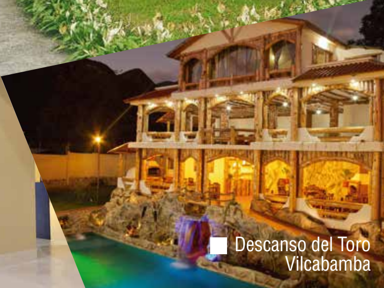
■ Descanso del Toro Vilcabamba