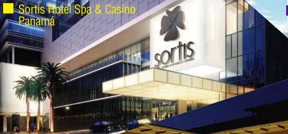
■ Sortis Hotel Spa & Casino Panamá