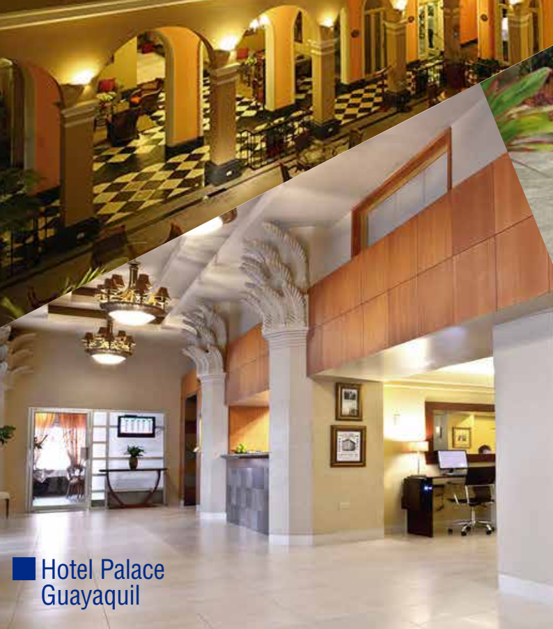
■ Hotel Palace Guayaquil