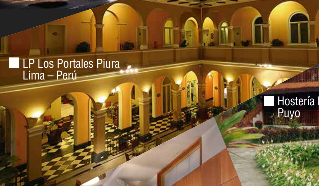
■ LP Los Portales Piura Lima – Perú